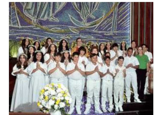
A Primeira Comunhão dos catequizandos - Página 13