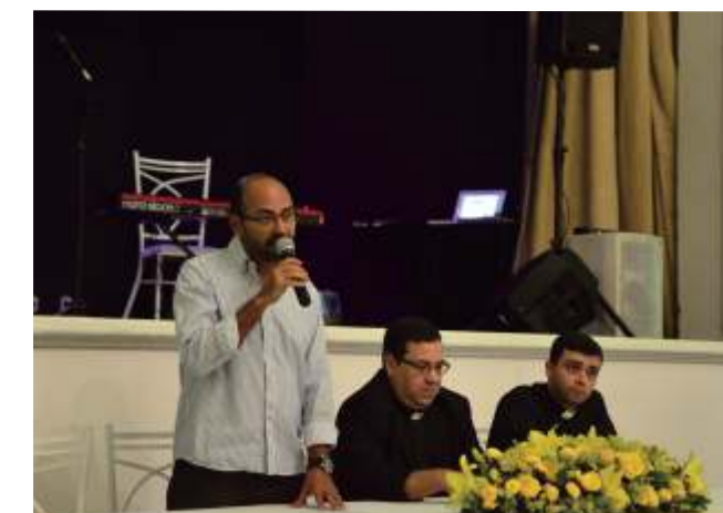
A nova Rádio Ave-Maria - Página 8