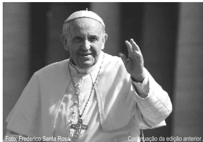
Continuação da edição anterior.