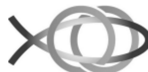
Equipes de Nossa Senhora