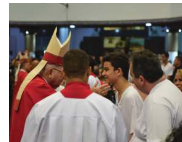
Crisma dos catecúmenos - Página 4