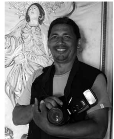
O fotógrafo Marconi Castro