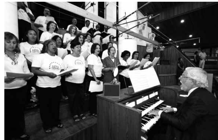
O órgão foi dedicado na Missa Solene pelo aniversário da cidade

Há neurologistas que afirmaram, após cuidadosas pesquisas, que este nobre instrumento, há séculos em uso em nossas catedrais, tem qualidades de som que atingem