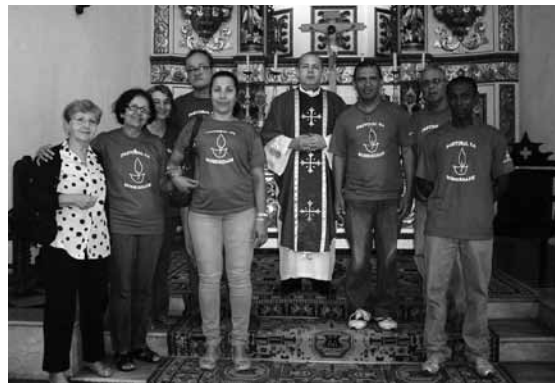
Missa de aniversário de 3 anos da Pastoral