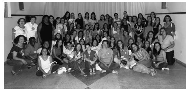
Nos dias 5, 6 e 7 de novembro, foi realizado o retiro feminino do MCC, em Rio Bonito. Mais fotos desses eventos em www.pnsassuncao.org.br

No dia 13, segunda-feira, será a vez da Ultreia festiva de Natal, às 20h, no salão social da Igreja Matriz Histórica. O evento será aberto a toda comunidade.