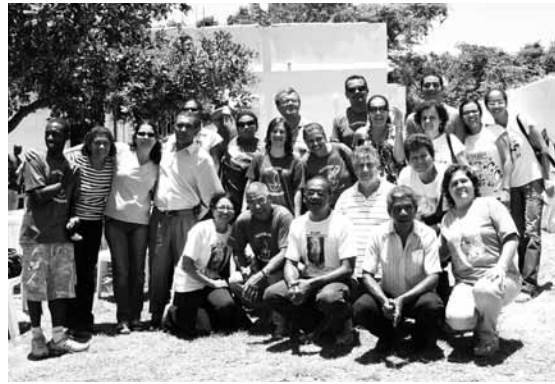
Equipe da Pastoral