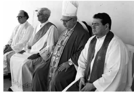
Missa de Inauguração