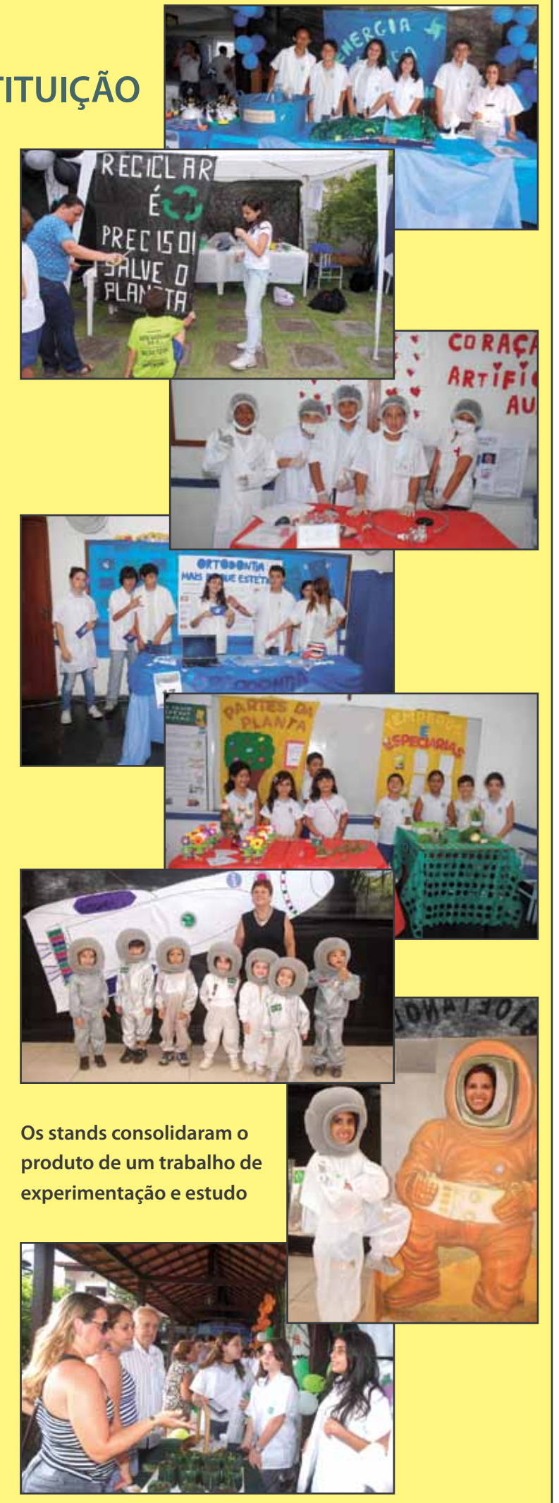
Os stands consolidaram o produto de um trabalho de experimentação e estudo